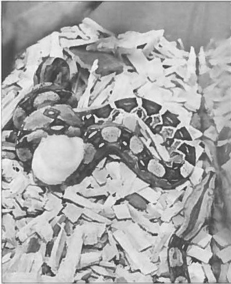
Het eerste voedsel.