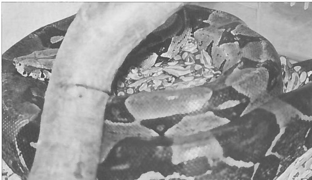
Een zorgzame moeder.

Foekema, G., Ontwikkeling en voortplanting van Boa constrictor (Linnaeus) in een huiskamerterrarium . Lacerta 31 (1973).