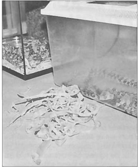
Jasjes uit!