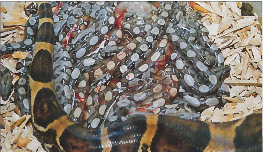
Na de bevalling.

De moeder, de jongen en de vader heb ik daarna weer bij elkaar gebracht. De moeder vervulde haar rol voorbeeldig. Keurig draaide zij een cirkel om de jongen. Zo heb ik de familie drie dagen laten liggen. De vader kwam vaak nieuwsgierig kijken. Zowel de moeder als de jongen trokken zich daar weinig van aan. De moeder reageerde fel op iedere beweging van buiten het terrarium, je kon zien dat ze hongerig was. De jongen heb ik uiteindelijk in een apart terrarium gedaan. De navelstrengetjes waren al bijna verdroogd. De moeder heb ik twee kleine ratten gegeven die ik toevallig nog had. Drie dagen later at ze nog drie grote ratten die ik in allerijl had laten laten komen. Meer voedsel vond ik niet verantwoord en ik besloot haar even te laten rusten.